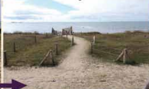
5 octobre 2011 état après la saison estivale