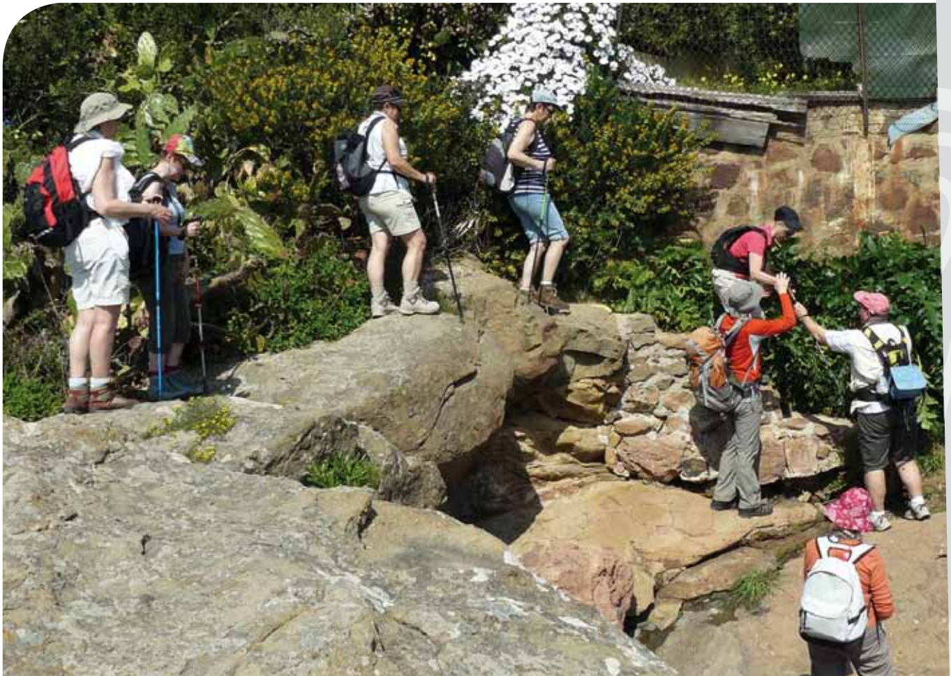
Nos randonneurs à Théoule sur Mer

Après la trêve estivale notre club a repris ses activités en organisant un voyage à Brest sur le site OCEANOPOLIS où nous avons pu découvrir le monde sous-marin des trois continents, puis sur le chemin du retour le nouveau pont de Térénez en passant par le Menez hom.