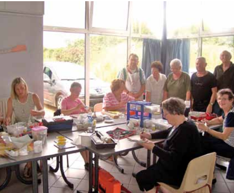
Préparation de la vente exposition