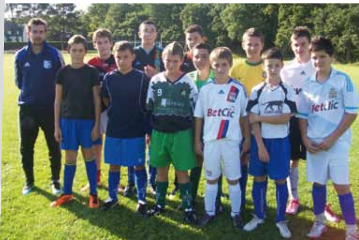
Le groupe U15