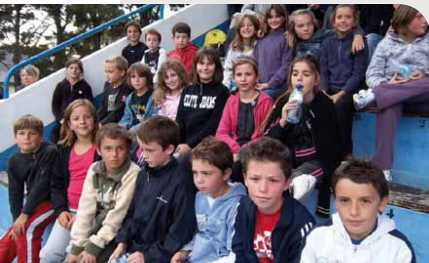
Les CM1-CM2 au cross organisé par le collège des Korrigans de Carnac. L'occasion de retrouver les anciens copains !

L'agent spécial Gastounet accompagne les élèves lors des apprentissages liés à la sécurité routière.