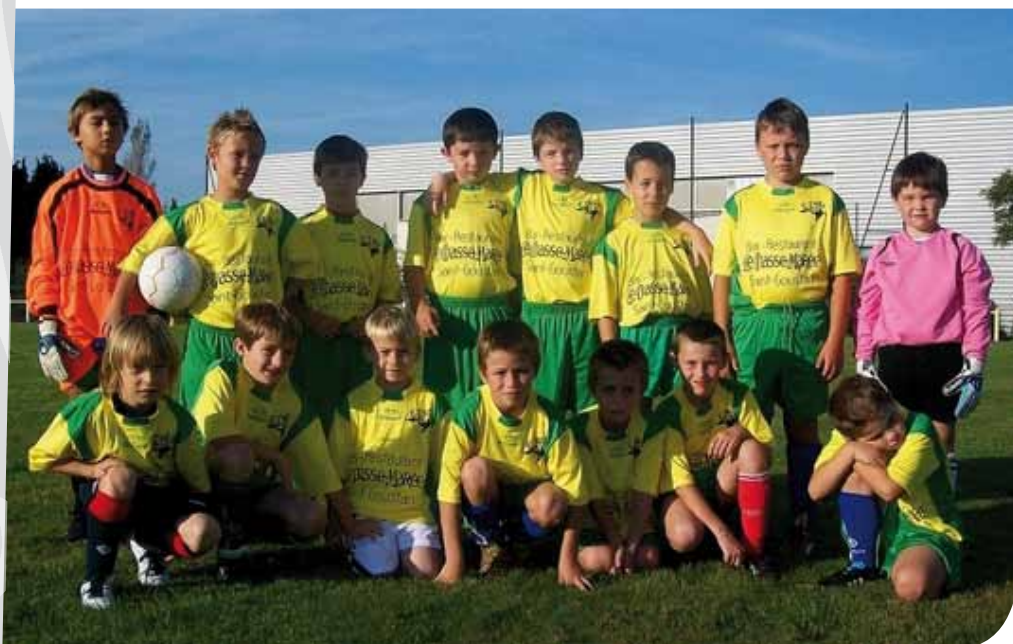
Le groupe U9