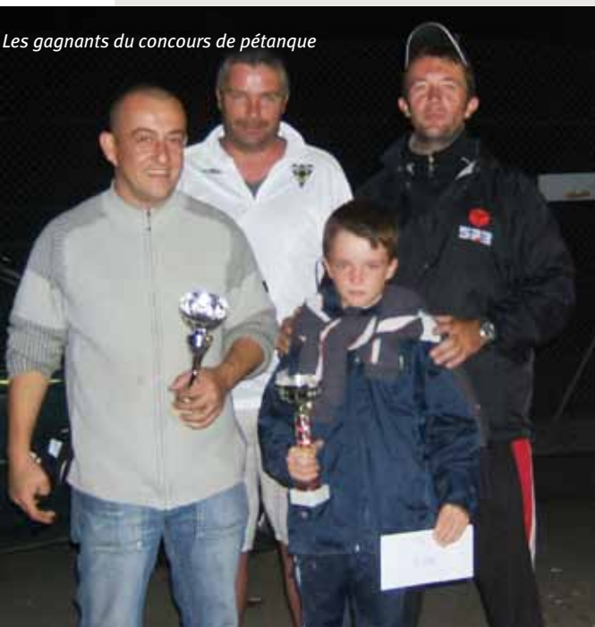
Les gagnants du concours de pétanque

Les supporters du club de football de l'Avant-Garde du Golfe de Locmariaquer continue à suivre les matchs à domicile ainsi que les matchs à l'extérieur de l'équipe A, B mais aussi des vétérans.