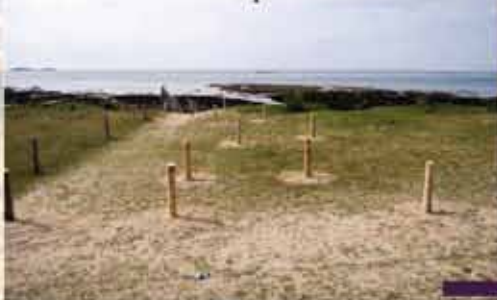
15 avril 2011 état après mise en défens