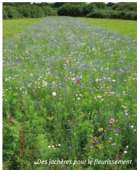
Des jachères pour le fleurissement