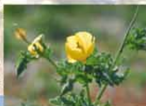
Glaucium flavum Pavot Cornu

Dans le cadre de l'aménagement du GR-34, le Conseil Général va prochainement participer à des travaux de balisage du cheminement sur cette portion et protéger par la même les espèces végétales remarquables de ces différents écosystèmes.