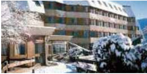
Centre d'accueil «renouveau vacances»