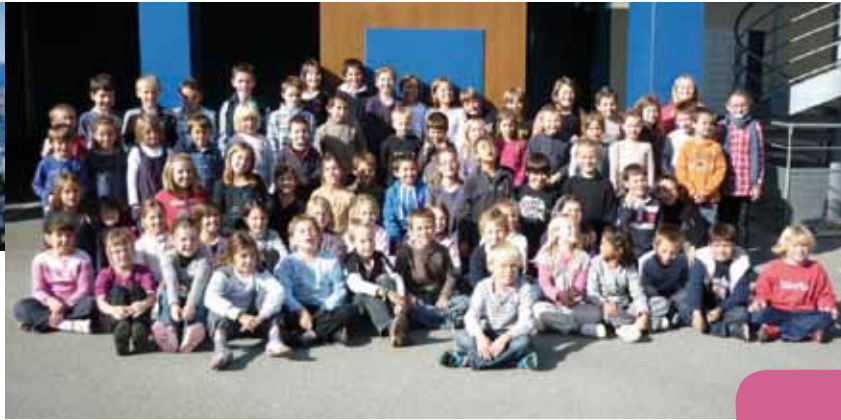
Les élèves du CP au CM2