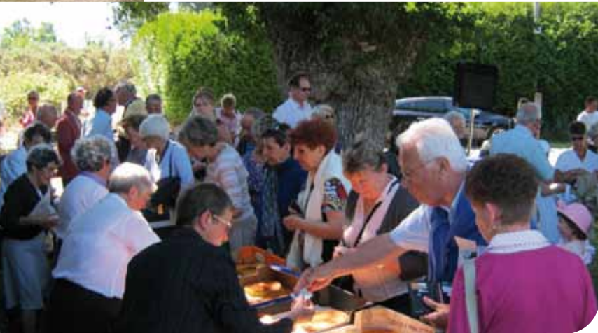
Vente de far breton après le pardon

Le 26 juin une foule nombreuse a suivi le pardon et le baptême, suivis du repas dans la prairie sous les chapiteaux dans une ambiance chaleureuse.